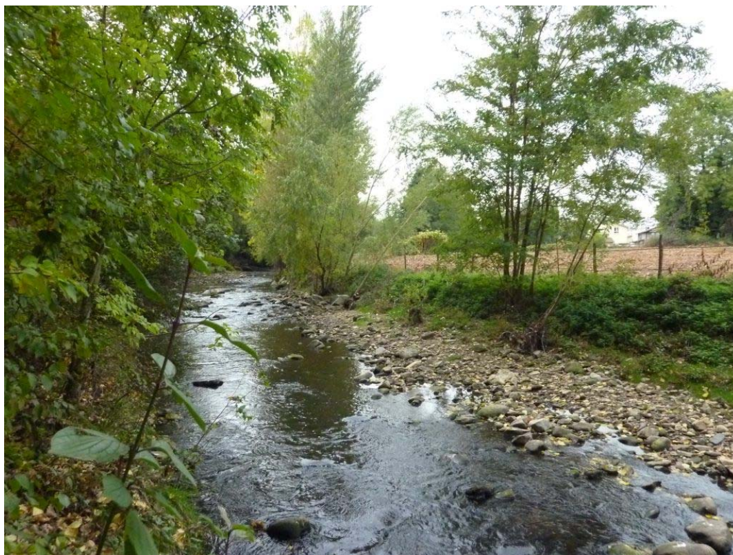
2- Vue du lit du Gier en amont du site (tronçon 1 – berge gauche à remodeler)