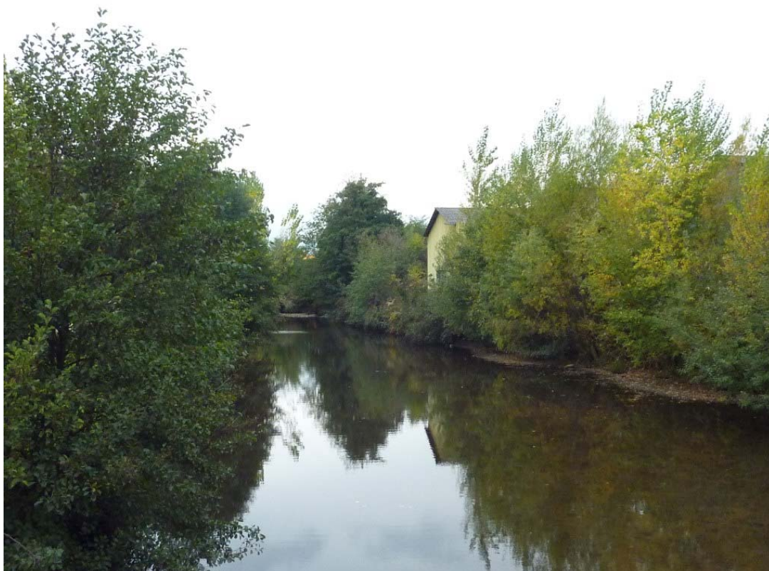
3- Vue du lit du Gier au droit du seuil de la Perronière (partie médiane du site)