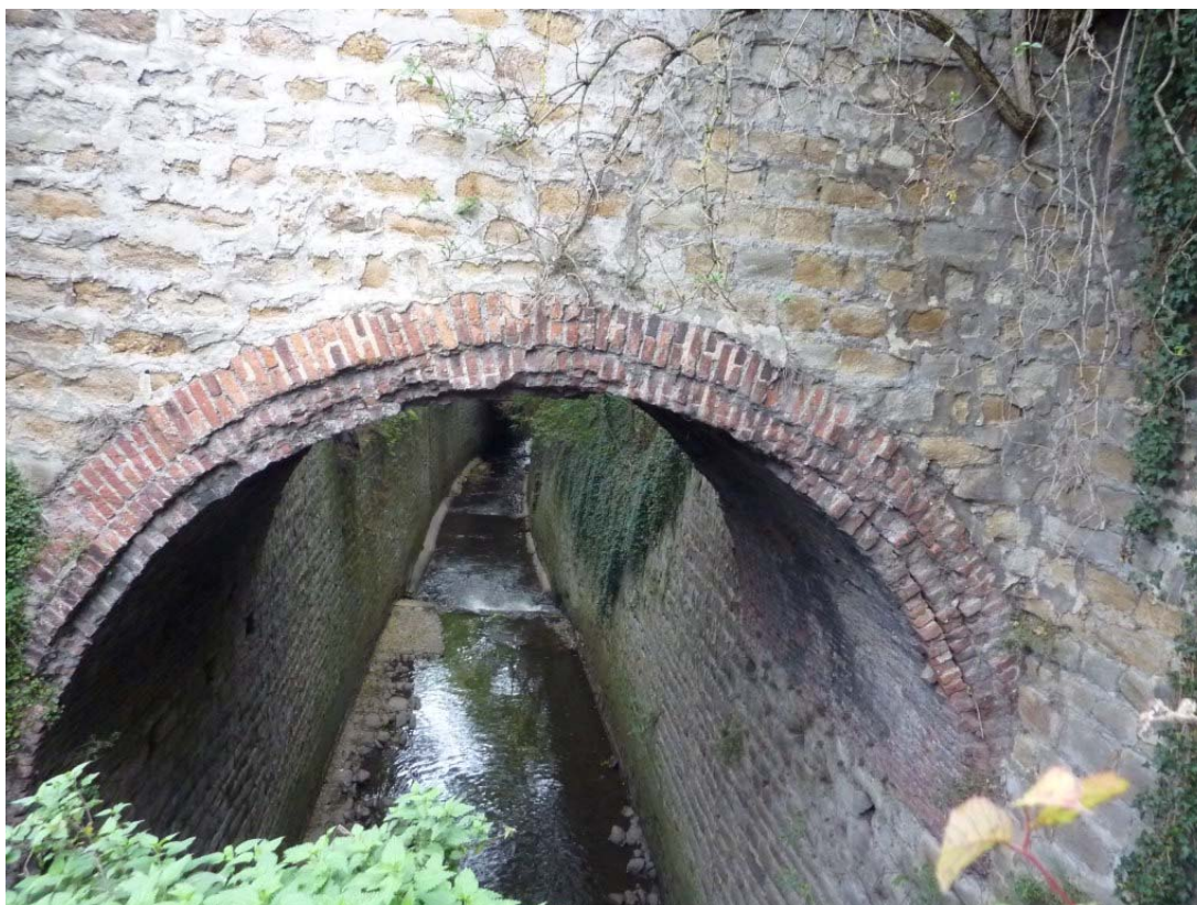
4- Vue du lit du Gier au droit de la section canalisée (partie aval du site – tronçon 3)